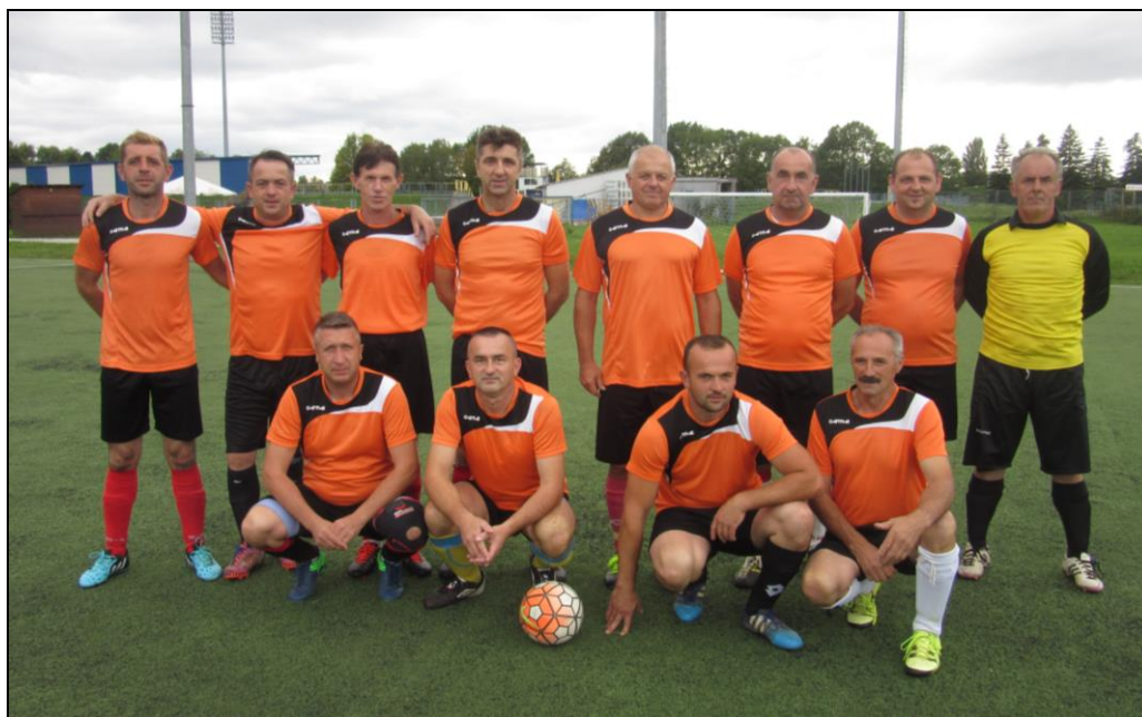
Momčad veterana Vojnić 95 – s nestrpljenjem očekuje prve bodove u prvenstvu!