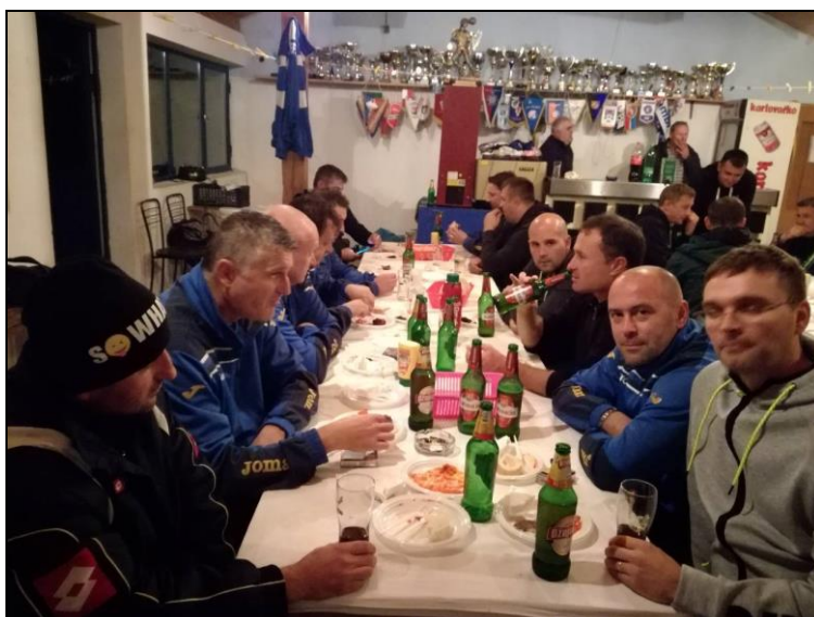
Došla nam je slika iz Slunja, gdje su obje momčadi na kraju nastavili zajedničko „treće poluvrijeme“! Bravo za obje momčadi.