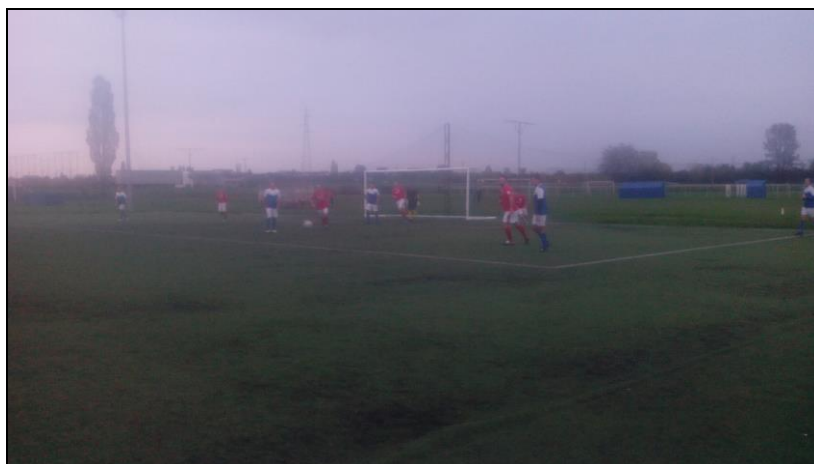
Detalji s utakmice Karlovac 1919 - Mostanje!